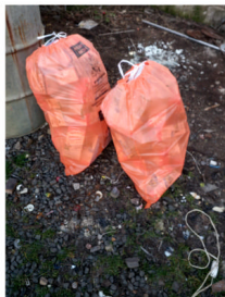
PET před sešlapaním

Poplatek za odpad pro rok 2023 budete platit až v lednu 2024!