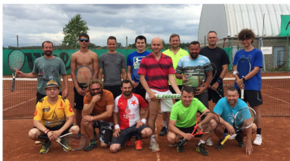
Lenešice Open 22 - 16.7.2022