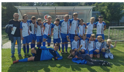
Utkání v Krásném Dvoře