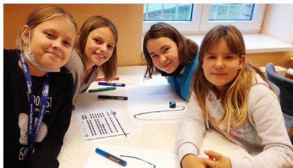
Programujeme s ozoboty

Pedagogové se účastní seminářů na různá témata: Minecraft nejen pro informatiku (1. i 2. stupeň), Základy blokového programování se Sphero (1. i 2. stupeň), Blokové programování ve Scratch (1. i 2. stupeň), Práce s liveworksheets (1. i 2. stupeň), iPady ve výuce, BlueBot (1. stupeň), atp. Své dovednosti pak předávají žákům. Žáci se zúčastnili programu Kyberšikana v rámci prevence soc. pat. jevů.