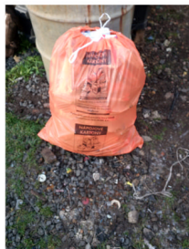
PET po sešlapaní