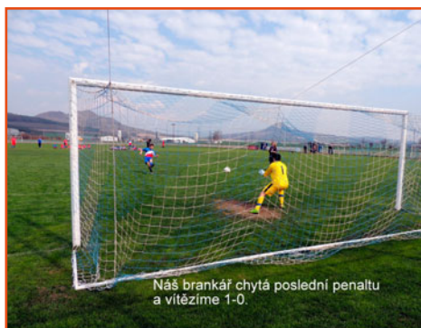
Náš brankář chytá poslední penaltu a vítězíme 1-0.

Fotbalový oddíl v soutěžním ročníku 2018-2019 uspořádal 45 domácích utkání na hřišti v Lenešicích a celkově mužstva odehrála 89 utkání ve všech soutěžích.