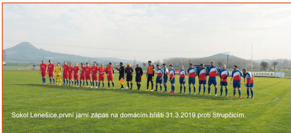
Sokol Lenešice, první jarní zápas na domácím hřišti 31.3.2019 proti Strupčicím.