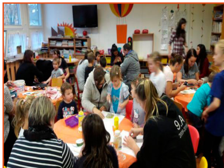
vánoční dílničky dětí a jejich rodičů