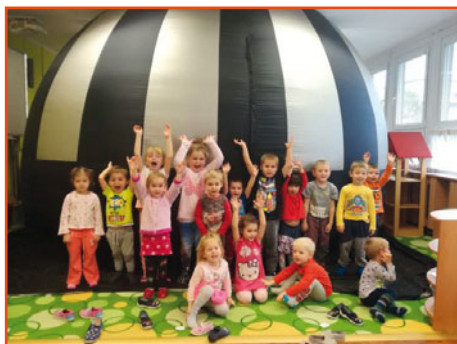
sférické kino v MŠ