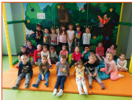
výlet do Jungle Arény v Mostě