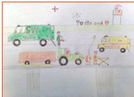
vítězná kresba, autor: David Haspeklo, 4. třída