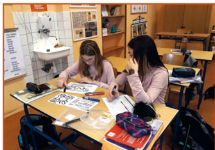
ozobiti v matematice