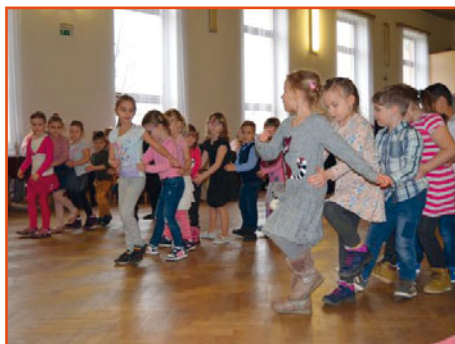
vystoupení dětí k MDŽ v Sokolovně