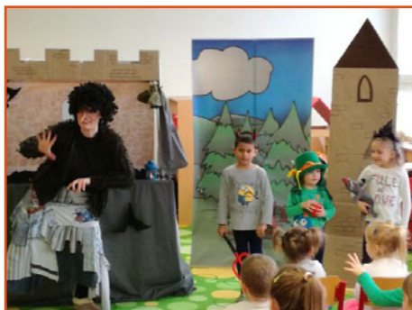
divadlo „Na hradě straší“ v MŠ