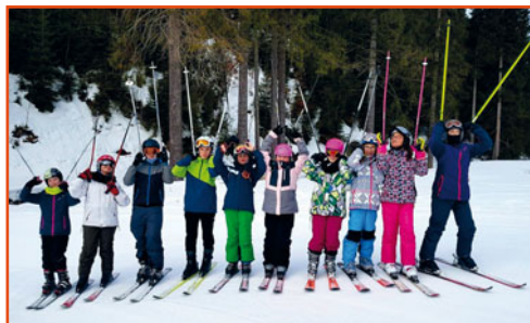
lyžařský výcvik Nové Město