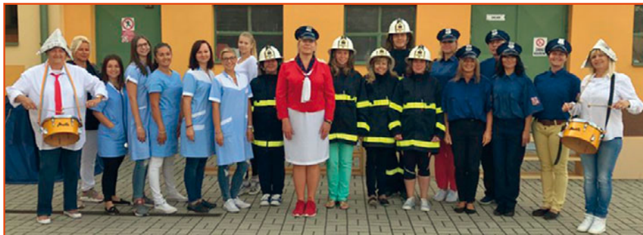
pedagogický sbor - školní rok 2018 / 2019

Letošní školní rok je provázen projektem: „ ZÁCHRANNÝ KRUH 112 “, svou koncepcí navazuje na předchozí celoškolské celoroční tematické projekty.