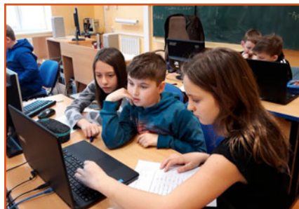
výuka v počítačové učebně