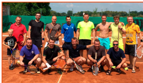
Tenisový turnaj Lenešice Open

Tělovýchovná jednota Sokol Lenešice, spolek by na závěr poděkovala všem svým členům, funkcionářům, trenérům, aktivním sportovcům a fanouškům všech sportovních týmů. Velké poděkování za podporu patří OÚ Lenešice.