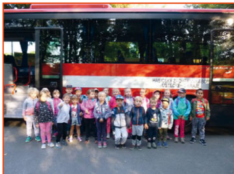
hasičská soutěž „Mladý soptík“

Od září do března proběhlo v mateřské škole mnoho akcí, na fotografiích se můžete na některé z nich podívat.