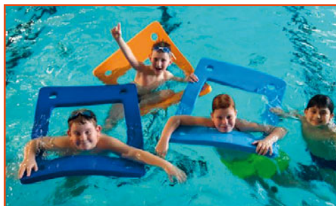
kurz plavání Postoloprty